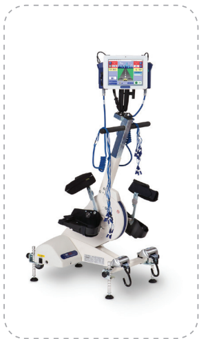
RT300 leg system — ФЭС нижних конечностей.