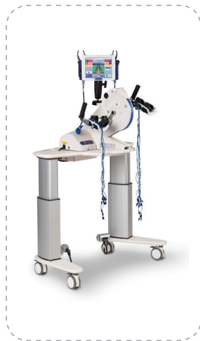
RT300 arm system — ФЭС верхних конечностей.