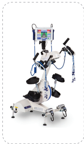
RT300 leg&arm system — ФЭС верхних и нижних конечностей.