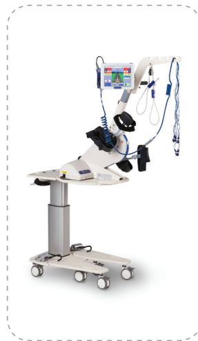
RT300 supine — ФЭС нижних конечностей из положения «лежа».