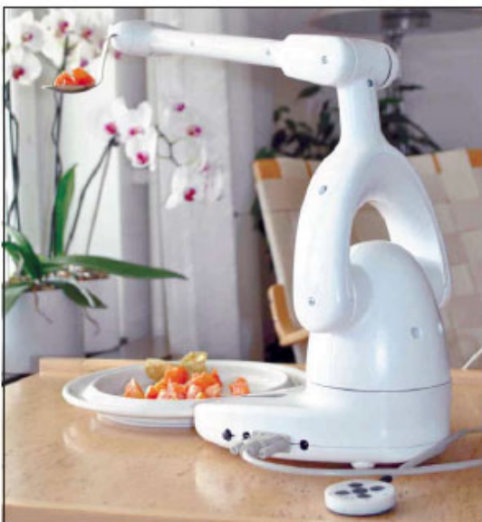
Рис. 4. Индивидуальный бытовой манипулятор Bestic