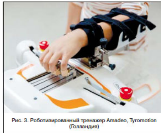
Рис. 3. Роботизированный тренажер Amadeo, Tyromotion (Голландия)