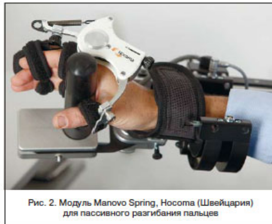
Рис. 2. Модуль Manovo Spring, Носота (Швейцария) для пассивного разгибания пальцев